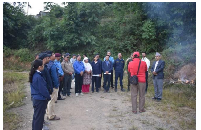
अनुगमन कार्यक्रमको समापन हुँदै गर्दा