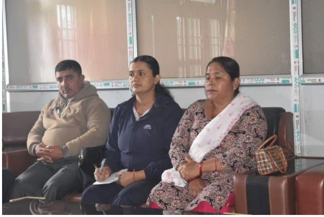
अनुगमन पुर्वको तयारी बैठक