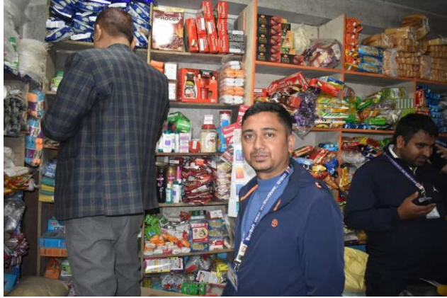
पसल अनुगमन गर्दै अनुगमन टोली