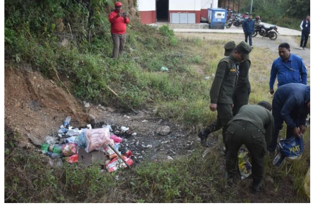
अनुगमनको क्रममा जफत गरिएको सामान नष्ट गर्दै