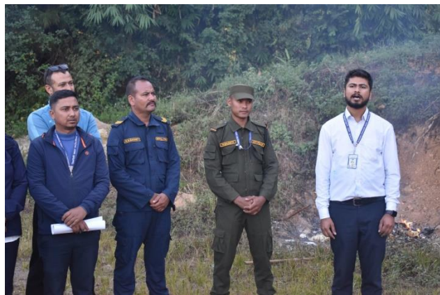
अनुगमनको क्रममा भएगरेको समग्र क्रियाकलाप प्रस्तुत