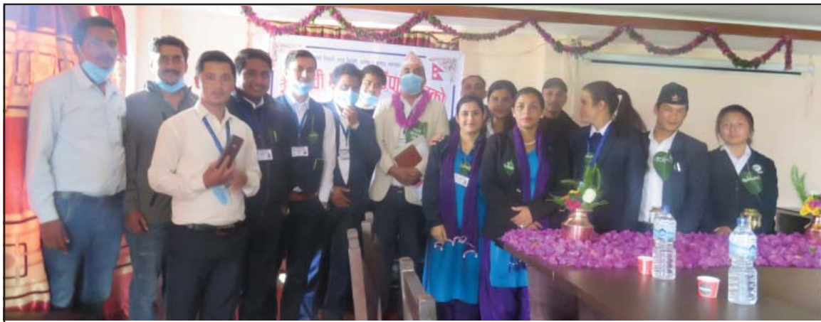
सातौं गाउँ सभामा उपस्थित कर्मचारी गणहरू ।