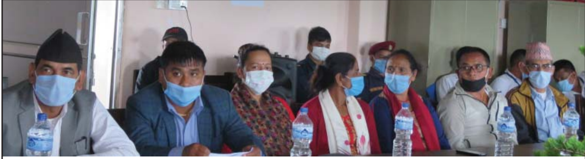
सातौं गाउँ सभाका उपस्थित सदस्य गणहरू ।