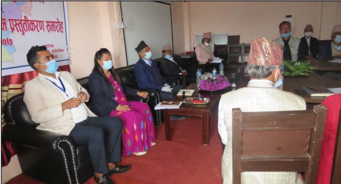
सातौं गाउँ सभामा उपस्थित सभाध्यक्ष, उपाध्यक्ष लगायत ।